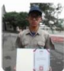
▲全國技能競賽優勝