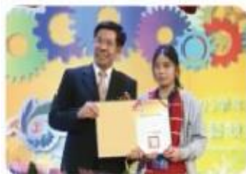
▲工業類學生技藝競賽獲獎